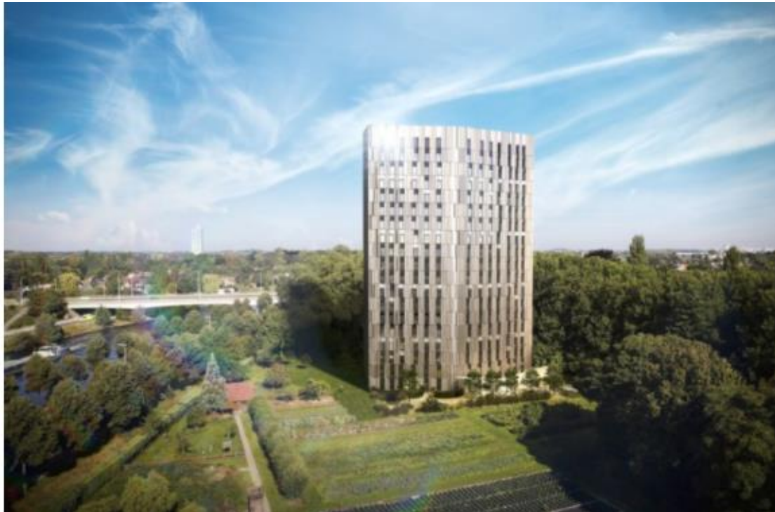
Bro Upkot, de hoogste studententoren van Vlaanderen.

In België is Upgrade Estate actief in zeven steden: Gent, Antwerpen, Brussel, Kortrijk, Brugge, Bergen en Hasselt. Plannen om uit te wijken naar het buitenland zijn er nog niet. “We willen op onze manier blijven werken. Toen we ons eerste kot hadden, gingen we al eens een pint drinken met de studenten, of een spaghetti eten. Dat doen we nu nog, zij het wel op iets grotere schaal. Als we naar het buitenland gaan, moeten we dat misschien opgeven en dat willen we niet.”