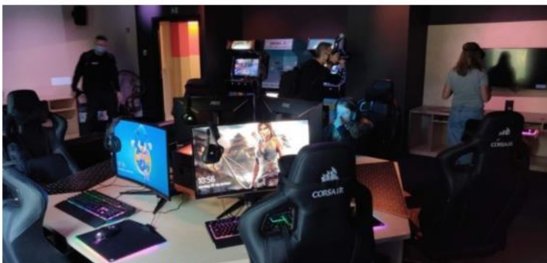
■ De gaming room in Bro Upkot.