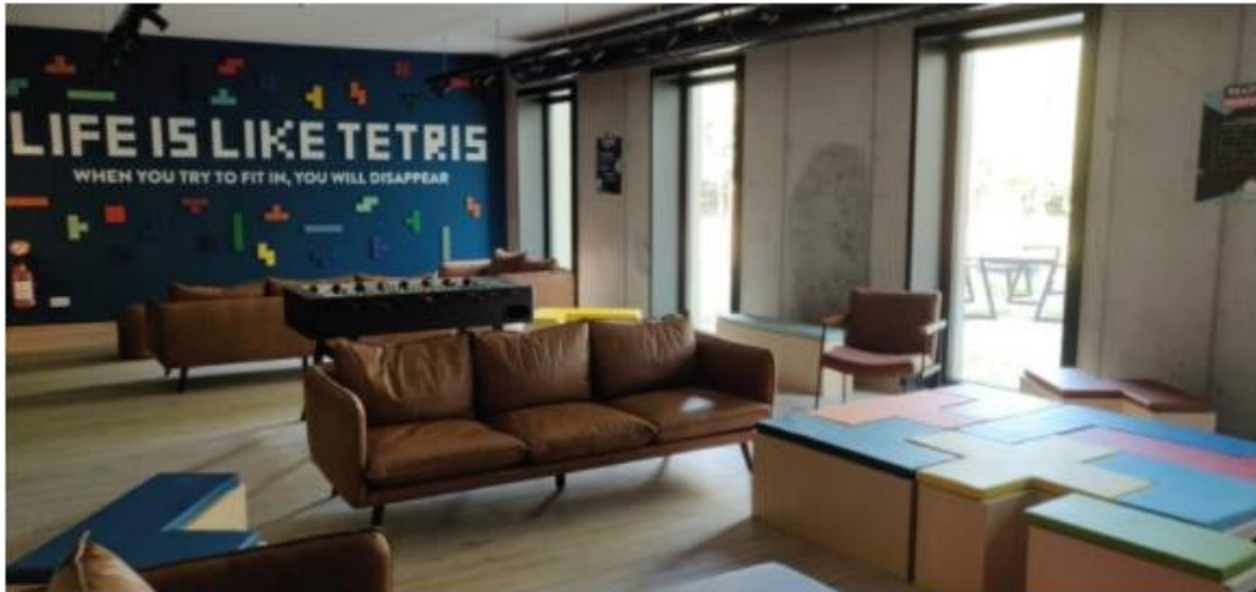
■ Een van de gezamenlijke ruimtes in Bro Upkot.